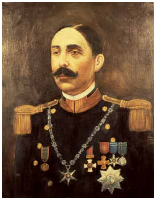
Henrique Correia da Silva, governador de Macau (1919-1922).

No período que vai de 1916 a 1930, Macau teve oito governadores: Manuel Ferreira da Rocha (1916-1918), Artur Tamagnini Barbosa (1918-1919), Henrique Correia da Silva, conde de Paço d'Arcos (1919-1922), Rodrigo Rodrigues (1923-1925), Joaquim Tomé dos Santos, Manuel Firmino Magalhães (1925-1926), Hugo Castelo Branco e Artur Tamagnini Barbosa (1926-1931). Destes sabe-se que três foram maçons: Manuel Ferreira da Rocha, oficial de Marinha, membro do Conselho do Governo, Henrique Correia da Silva e Rodrigo Rodrigues. O primeiro terá ingressado no funcionalismo ultramarino pela mão do seu “irmão” Carlos da Maia logo na sequência da revolução republicana, liderando o partido da União Republicana. 30 Henrique Correia da Silva foi capitão-de-mar-e-guerra, ministro do Ultramar. 31 Rodrigo Rodrigues foi médico militar, ministro de Interior da República, tendo sido nomeado governador de Macau em 5 de Janeiro de 1923. Analistas consideram que este governador conseguiu fazer o pleno das várias sensibilidades, mostrando-se aberto a receber os portugueses que quisessem apresentar questões e reclamações e fazendo sentar pela primeira vez os